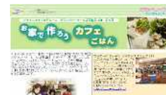
バナー広告からの記事