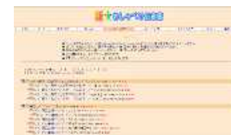
おしゃべり伝言板