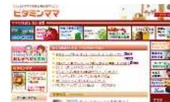
ビタミンママHPトップ