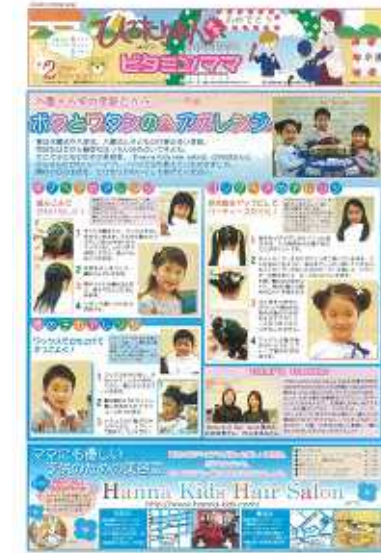
ひろたりあん通信withビタミンママ